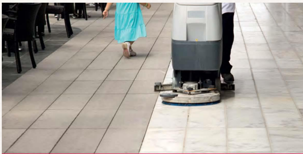
Entscheiden und handeln