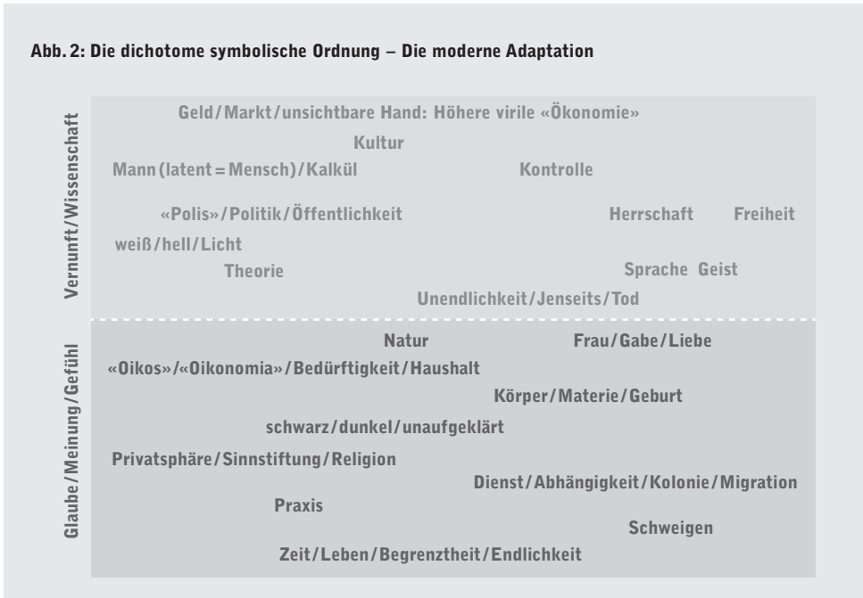
Abb. 2: Die dichotome symbolische Ordnung – Die moderne Adaptation