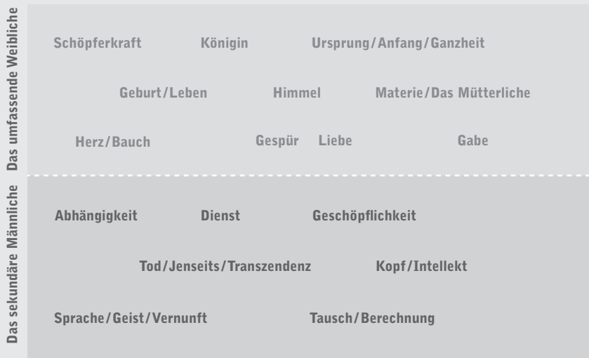
Abb. 3: Die dichotome symbolische Ordnung – Das matriachale Umkehrmodell

Während die Entwürfe eines selbstregulierten besseren Anderen und die entsprechenden lebenspraktischen Experimente auf kleine, aber durchaus subversiv wirksame Gruppen beschränkt bleiben, bauen staatliche Politiken hinsichtlich der Frage, wie mit den Diskriminierten und der Umwelt umzugehen sei, vorzugsweise auf das Prinzip der Integration (vermeintlich) defizitärer Bereiche und Gruppen in die dichotome Ordnung: Mädchen aus der Unterschicht oder mit «Migrationshintergrund» sollen gleiche Bildungs- und Karrierechancen bekommen; erfolgreiche «Aufsteiger» werden als vorbildhaft gefeiert; «Karrierefrauen», die ihre «Work-Life-Balance» im Griff haben, werden zur Norm erhoben; «Karrierehindernisse» durch Maßnahmen wie permanente Weiterbildung, Kindergeld, außerhäusliche Kinderbetreuung oder Vaterschaftsurlaube beseitigt; die möglichst flächendeckende Überführung des Care-Sektors in bezahlte Dienstleistungen wird empfohlen; 120