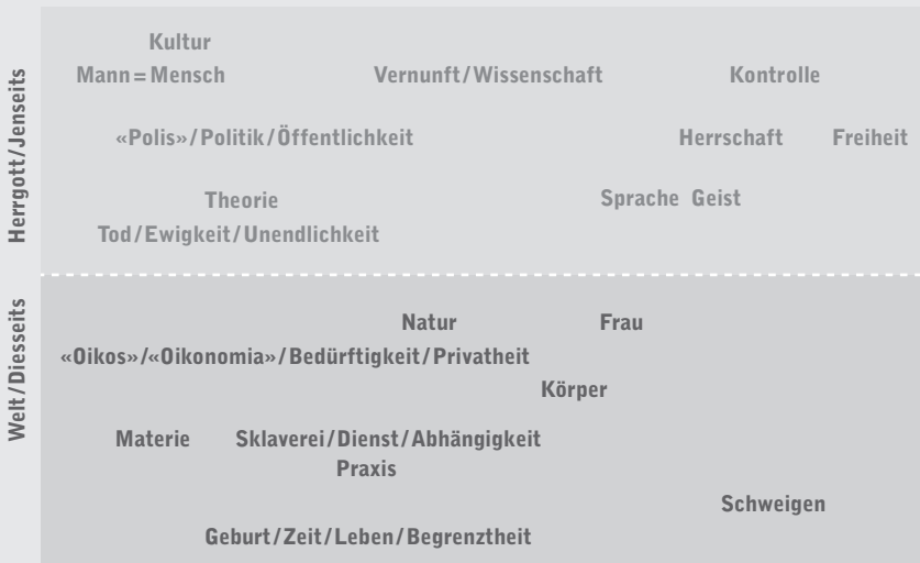
Abb. 1: Die dichotome symbolische Ordnung – Das vormoderne Modell

Ausdrücklich nicht mehr wissen zu wollen, was oben und unten ist, bedeutet nun allerdings nicht, größtmögliche analytische Klarheit per se als Vereinfachung zurückzuweisen. Ich werde mich deshalb in diesem Kapitel sogar an schematische Darstellungen komplexer Zusammenhänge wagen. Die sind zwar selbstverständlich mit Vorsicht zu genießen. Manchmal sind Vereinfachungen aber hilfreich, dann nämlich, wenn sie Übersicht schaffen, wo, wie im vorliegenden Fall, Kompliziertheit nicht nur in der Sache selbst liegt, sondern auch immer wieder im Sinne eines