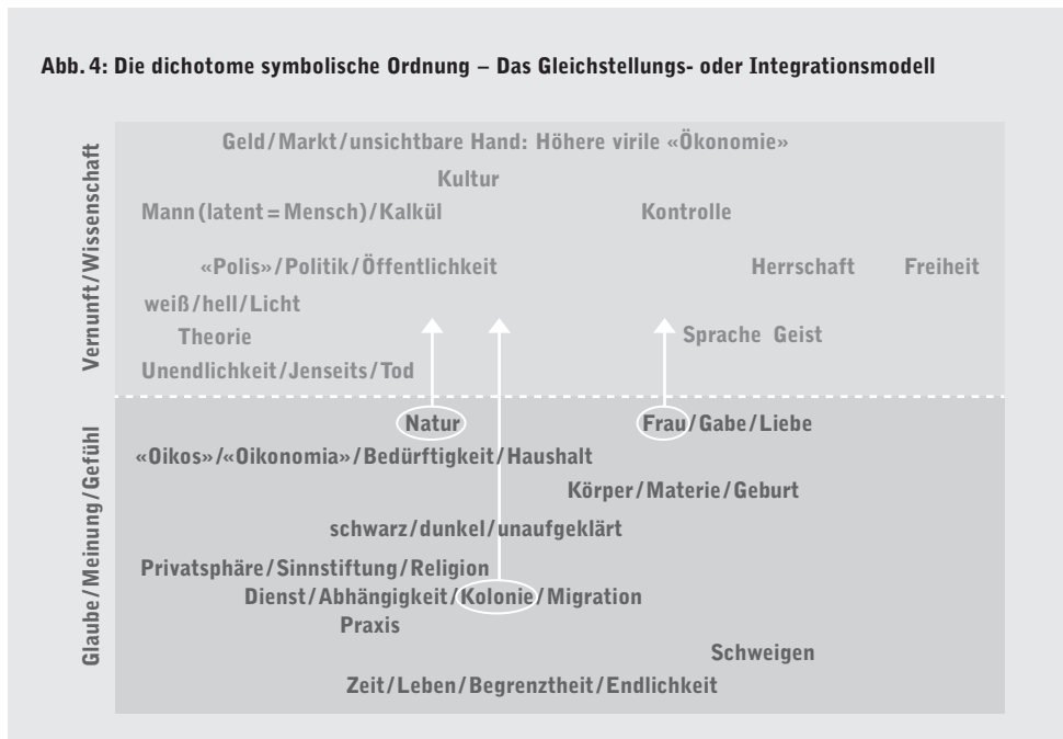
Abb. 4: Die dichotome symbolische Ordnung – Das Gleichstellungs- oder Integrationsmodell

Tatsächlich kann die «Gleichstellung» der oder des Ausgegrenzten, verstanden als isolierte Praxis oder gar Königsweg der Befreiung, nicht umfassend im Sinne des guten Zusammenlebens aller wirken, aus einem einfachen Grund: Das bisher von den angeblich naturnäheren Menschen in naturalisierten Sphären erledigte Arbeitsvolumen verschwindet nicht, wenn man einigen der bisher Ausgeschlossenen, zum Beispiel weißen Mittelschichtsfrauen oder migrierenden Akademikern, das zweifelhafte Privileg zugesteht, in «höhere» Sphären aufzusteigen. Und die Natur, die menschliche wie die außermenschliche, bleibt begrenzt, verletzlich und an nicht austauschbare Kontexte gebunden, auch wenn es rechnerisch möglich ist, sie in